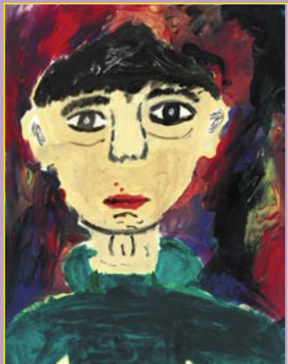
VEDRAN TOMIČIĆ, 6. r