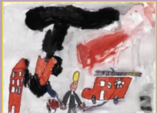
SABINA FETIĆ, 1. r.